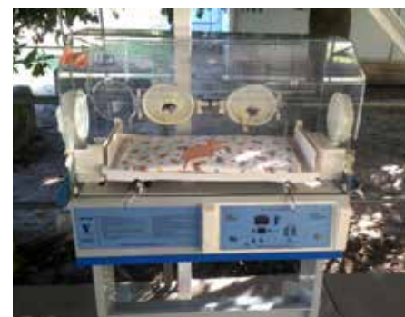
boven: educatie van hiv-positieve moeders, links: pasgeboren baby's, midden: demonstratie van het gebruik van vrouwencondoom, rechts: couveuse