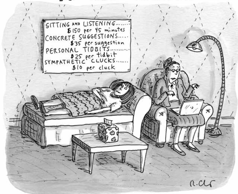
ROZ CHAST/NEW YORKER