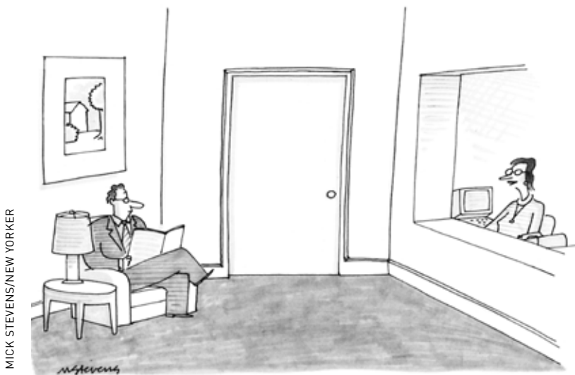
MICK STEVENS/NEW YORKER

Hieronder een variant op het thema 'geld': een typische cartoon zoals er velen zijn verschenen in het Amerikaanse cartoonwalhalla The New Yorker – de tekenaar heet Mick Stevens: