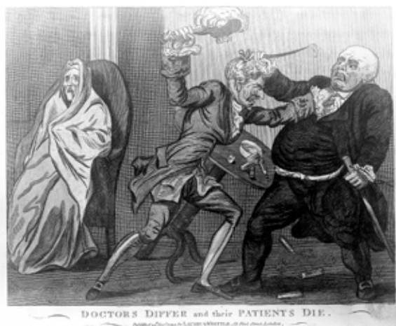
DOCTORS DIFFER and their PATIENTS DIE.

Een derde, telkens terugkerend thema is ruziënde artsen. Ze zijn het niet eens over de juiste diagnose en vergeten ondertussen de patiënt terwijl ze staan te delibereren, of ze beschouwen de patiënt louter als een interessant object. Een fraai voorbeeld is deze vroege plaat van de Schot Isaac Cruikshank (1764-1811) uit 1794: