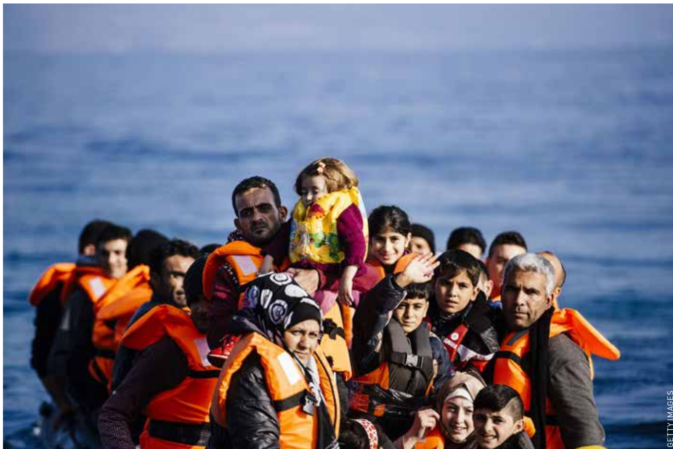
Duizenden vluchtelingen per dag hebben de dood in de ogen gekeken na een levensgevaarlijke tocht over zee.

grond, maken foto's, selfies. Ik til een oude man met krukken uit de boot. Hij roept iets, zijn bril is kwijt. Ik snap zijn paniek. Waar zou ik zelf zijn zonder bril? We zoeken, maar vinden hem niet. De kust is bezaaid met weggegooid zwemvesten. Alleen al op Lesbos komen per dag tussen de vierduizend en zevenduizend mensen aan.