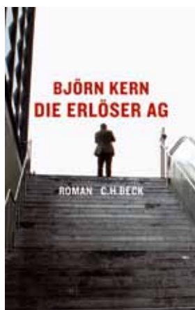
De hoofdpersonen in Die Erlöser AG vinden dat ook onvrijwillige euthanasie mogelijk moet zijn.