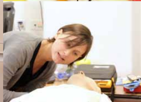
A(n)iossen in de Amsterdamse regio krijgen tijdens de Bagage-cursus onder meer training in Basic Life Support.