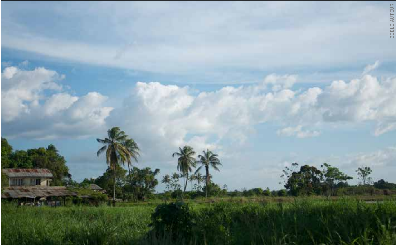
Nickerie is het rijstdistrict van Suriname; landbouwgif is op elke straathoek te koop en staat in elk schuurtje op de plank.