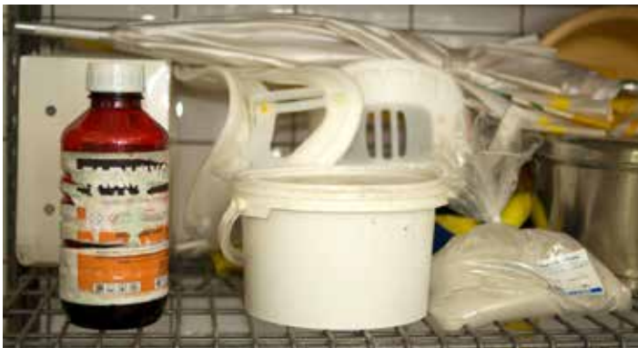
Een fles herbicide en een zak Fullerse aarde in het spoelhof van het ziekenhuis in Nickerie.