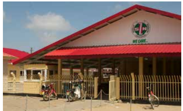
De hoofdingang van het streekziekenhuis.

huiselijk geweld. Het zijn vaak jonge mensen: tieners, adolescenten en jongvolwassenen. Lokaal onderzoek heeft aangetoond dat de stappen tussen het denken aan suicide, het plannen en het daadwerkelijk doen zeer kort zijn in Suriname. Veel pogingen hebben dus een impulsief karakter. De meeste mensen hebben na inname al snel spijt, maar dan is het te laat. Het is dan wachten op een zekere, ellendige dood.