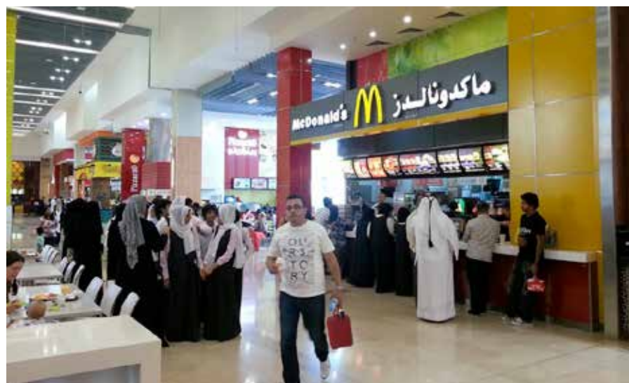
Fastfood is populair in de Verenigde Arabische Emiraten. McDonald's serveert de McArabia, een Arabische hamburgervariant met kip op een pitabroodje.

ontdekking van het zwarte goud maakte het land een enorme economische groei door. Father Zayed, zoals voormalig Sheikh Zayed bin Sultan Al Nahyan liefkozend wordt genoemd, investeerde een groot deel van de inkomsten in gezondheidszorg, onderwijs en infrastructuur. Met deze welvaarts groei adopteerde men een westers dieet en de auto als standaardvervoermiddel. Er zijn weinig veilige wandel- en fietspaden