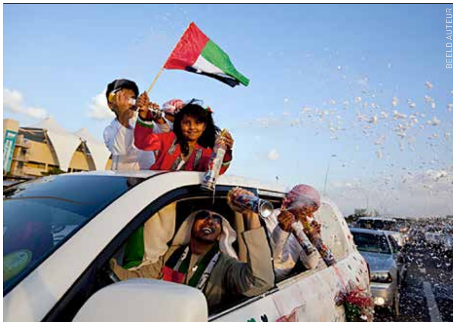
Kinderen hangend uit de auto op de nationale feestdag. Ook buiten deze feestdag om zie je kinderen op deze manier uit de auto hangen.